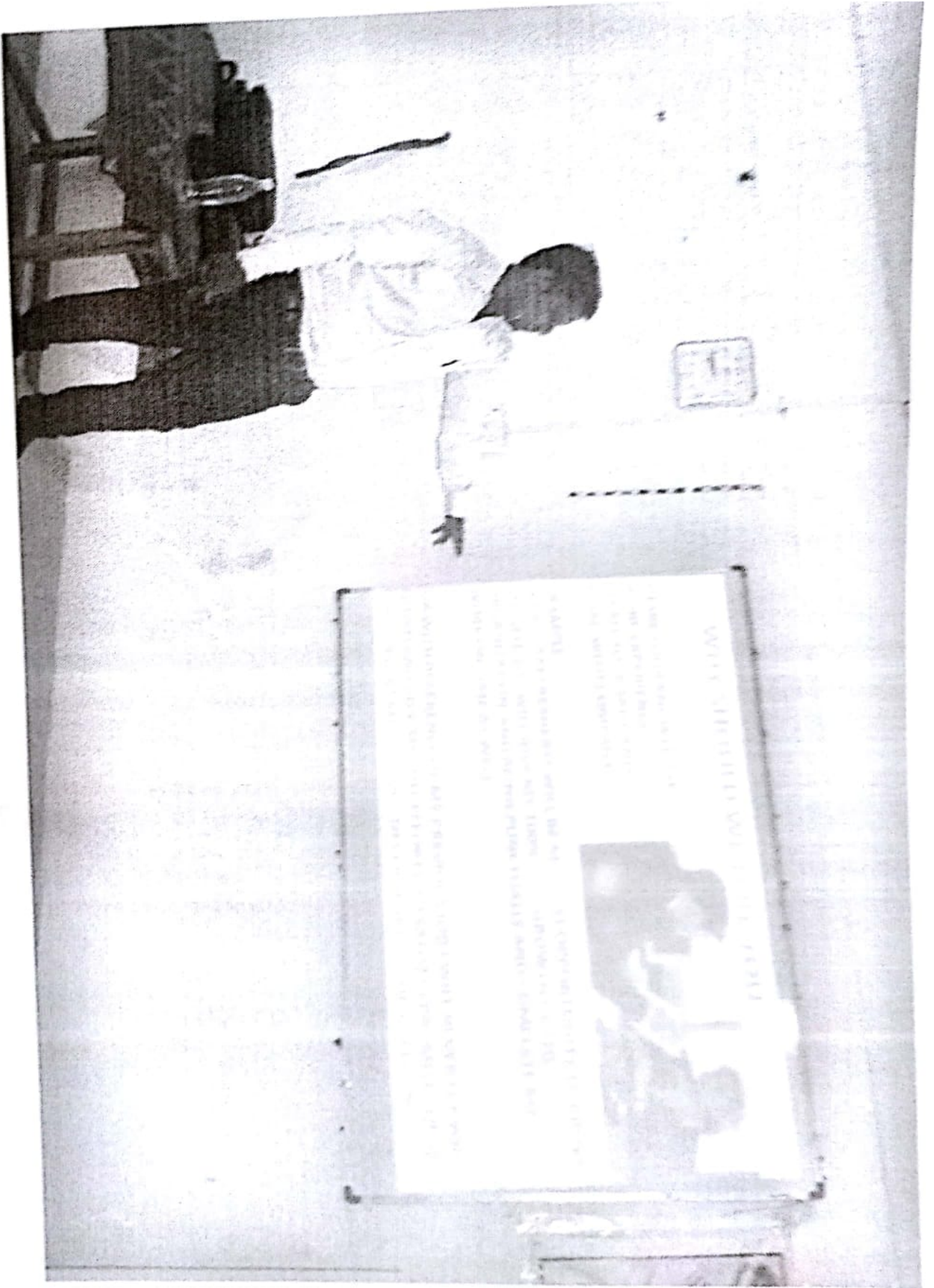
Office Attitude and Manners ଧର ଚାକିରୀ ସାଧନା କ୍ଷମା ପ୍ରଦର୍ଶନର ଉଦ୍ଦେଶ୍ୟରେ, ଚା. 18/2/2017