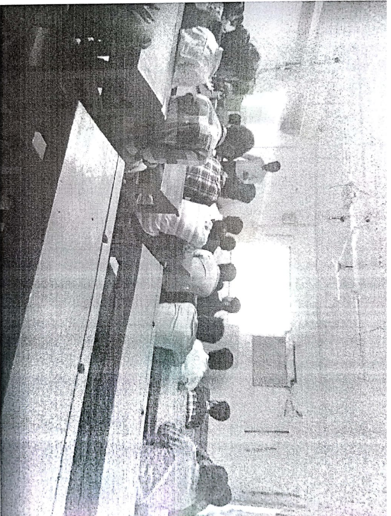
Teaching How to make C.V. ଧୂର ଲାଲୀନ ଧାନ୍ୟା ଶ୍ରୀ ପର୍ଲପୁରାଣ ଧରାଣ, ଲା. 16/2/20